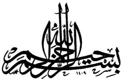
شكل زخرفي للبسملة بخط الثلث